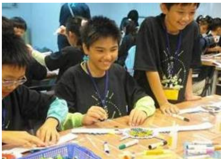
三峽區 插角國小 共有 187 位師生參觀 上圖為學生開心地參與 DIY 活動