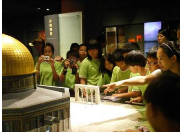
橫山國小共有 101 位師生參觀 上圖為學生參觀建築模型-聖石廟