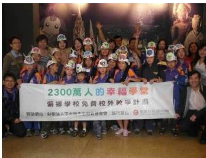
雙溪區 上林國小 共有 36 位師生參觀 上圖為師生在本館一樓前合影