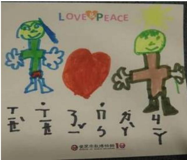
上林國小低年級學生感謝卡