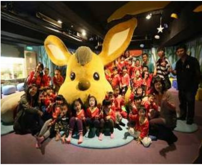
插角國小附幼 於兒館-大奇幻獸區前合影