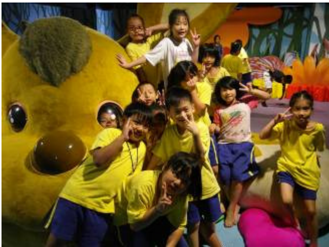
烏來國小 參觀兒童館與大奇幻獸合影