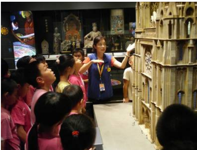
五寮國小共有 117 位師生參觀 上圖為學生參觀建築模型-夏特大教堂