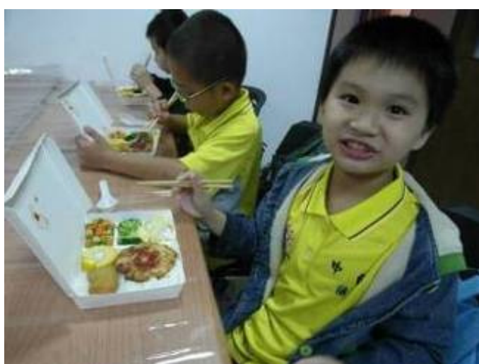
金山區 中角國小 共有 85 位師生參觀， 上圖為學生正使用養生蔬食便當