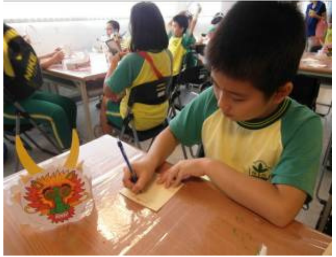
九份國小 學生正在寫下參觀感言