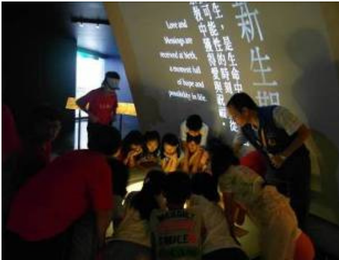
有木國小共有 46 名師生參觀， 上圖為學生參觀〈生命之旅廳〉