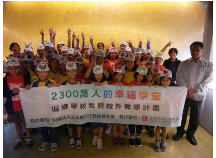
貢寮區福隆國小共有 81 名師生參觀 上圖為師生於展區-金色大廳合影