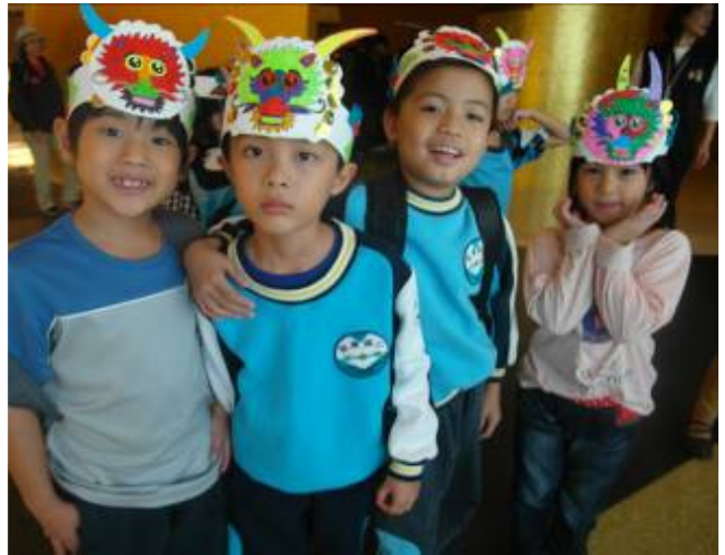
東澳國小 戴頭冠於金色大廳合影