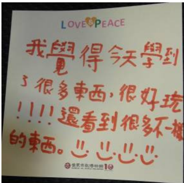
貢寮福隆國小學生感謝卡