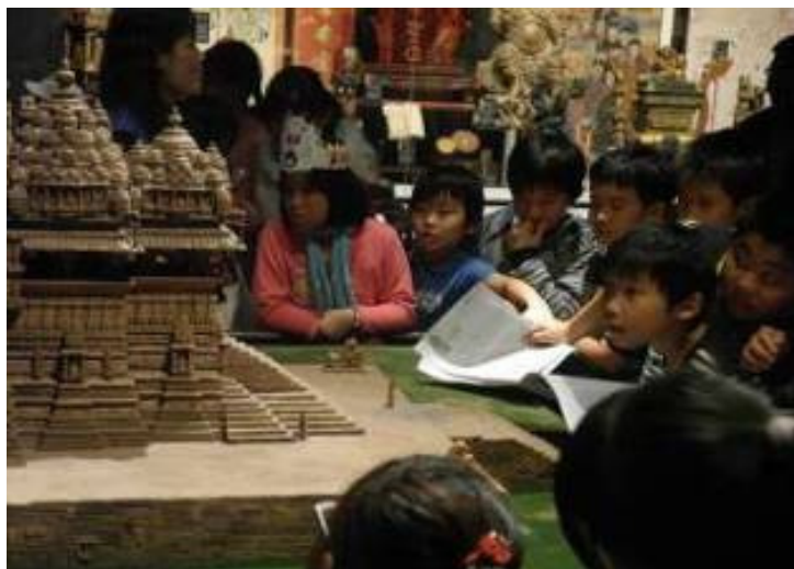
萬里區 大鵬國小 共有 104 位師生參觀， 上圖為學生參觀建築模型-印度濕婆神廟