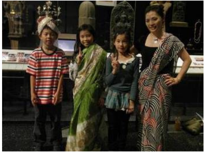
靖娟基金會-福安兒童共有 14 名師生 參與活動，上圖為學生穿著印度服飾與館員 合影