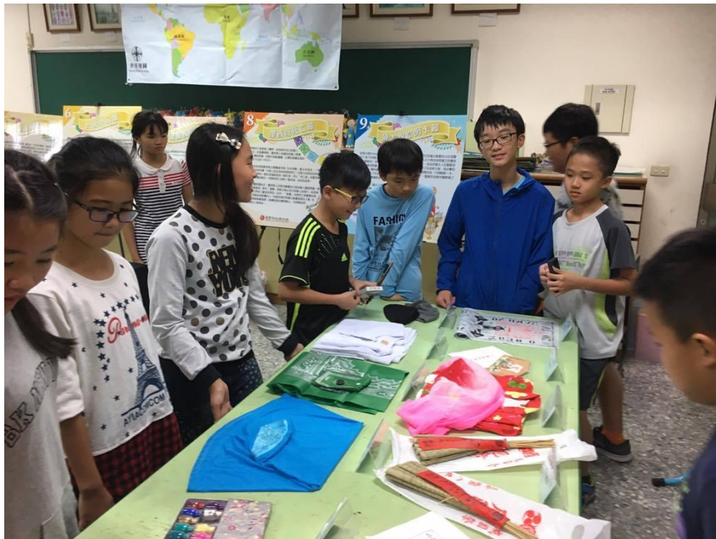
▲文武國小小小導覽員合照與導覽狀況