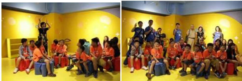
圖 3-4 圖說，溪尾國小學童體驗世界宗教博物館「愛的星球」新科技與動畫多媒體互動，相當投入。（圖由世界宗教博物館提供）

圖 1-2 圖說，台中偏鄉小校溪尾國小學童開心參觀世界宗教博物館「愛的星球」展區。（圖由世界宗教博物館提供）