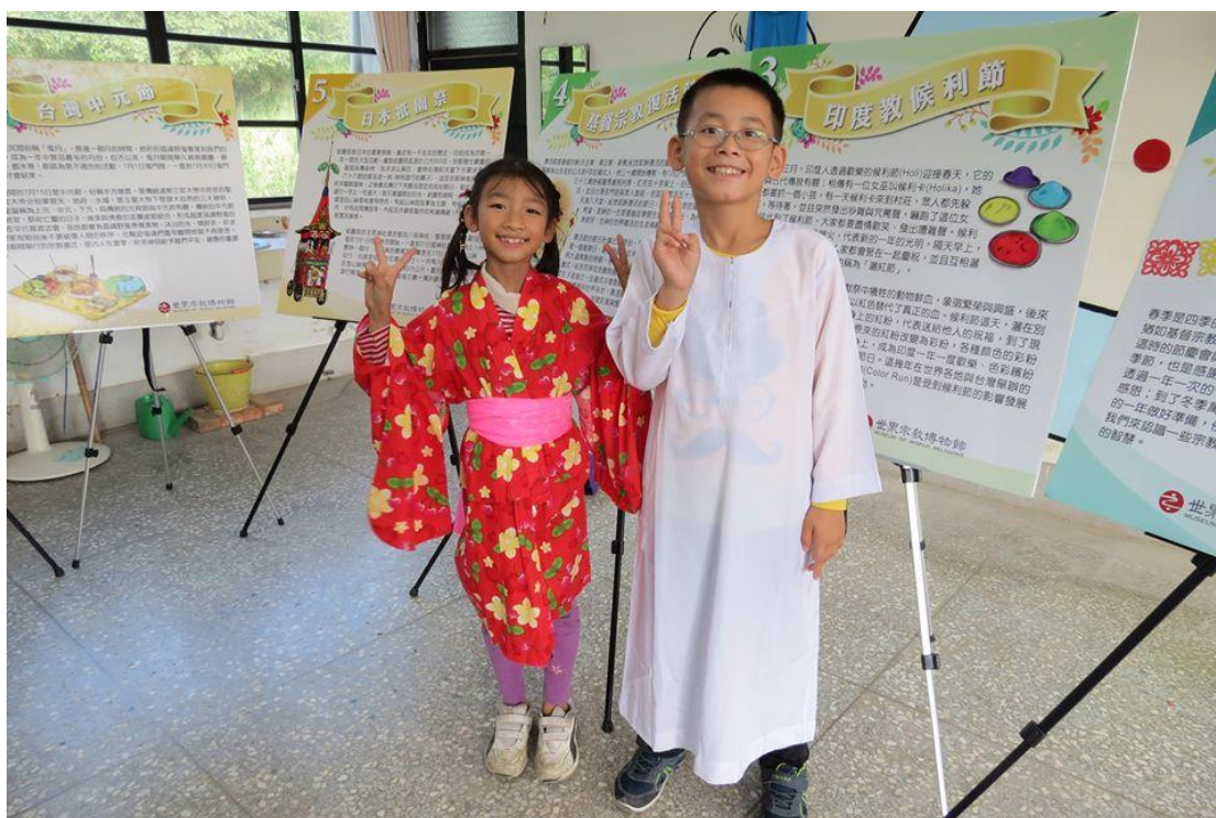
▲教師以別出心裁的方式展示教具，並邀請烏眉國小學生一同參觀