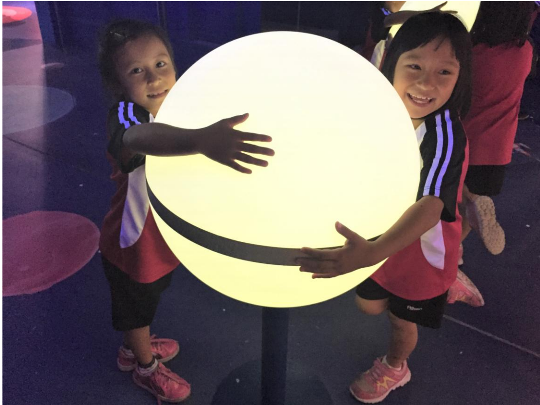
▲梅園國小的學生來自於天狗與梅園部落，全校都是原住民小朋友喔!!