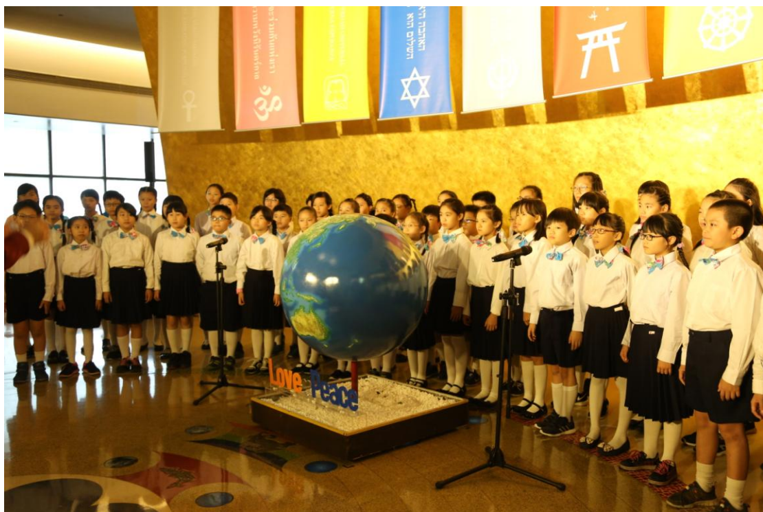
▲埔里國小合唱團於館慶當日表演三首曲目，為世界宗教博物館慶生，並且表演完後至愛的星球參觀。